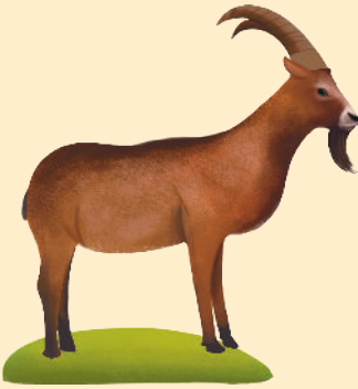
Çengel Boynuzlu Dağ Keçisi